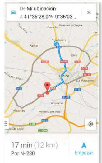
Localizan tu restaurante fácilmente