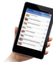
En las mesas del restaurante