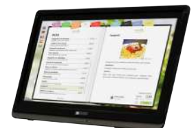
En la entrada del negocio